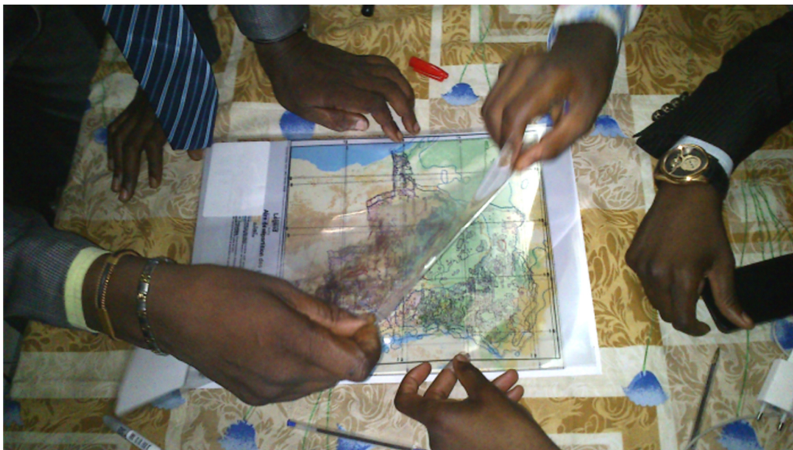
Зураг 1. Оролцогчид эрсдэл болон бусад шалгуурын өөр олон үр ашгийн газрын зургийг давхцуулж болно